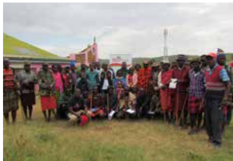
Un meeting della pace a Marti

e la maternity, ci sono le scuole (dalla materna alla secondaria)... E c'è ancora tanta povertà, ci sono malattie, ci sono politici che alimentano le lotte tribali, ci sono poche possibilità di lavoro per i giovani che hanno studiato... Ma oggi a Morijo c'è soprattutto una consapevolezza nuova, che va crescendo: la pace è possibile e con la pace tutto è possibile. E' il gran-