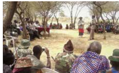
Agosto 2018: Il convegno a Morijo sulla pace

gli altri che credono in questo perché riusciamo a vivere questa tua eredità, perché abbiamo l'energia, le risorse e la buona salute per continuare ad aiutare quelli che hanno bisogno di noi. Continueremo a lavorare per la pace tra i Samburu, i Turkana e i Pokot e a sostenere la vita delle famiglie che tu hai sempre desiderato sopra ogni cosa".