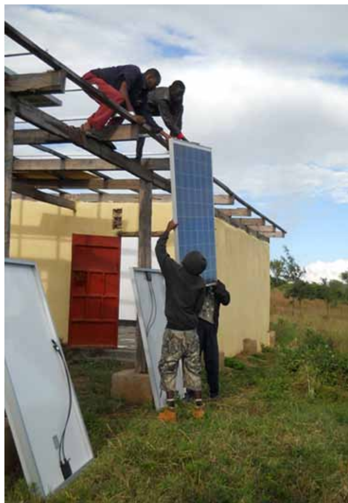
Installazione fotovoltaico (si montano i pannelli)

E' così partito il progetto. Si trattava prima di tutto di coinvolgere e motivare gli anziani e la popolazione del posto perché la cosa non risultasse calata dall'alto, ma voluta e costruita insieme. Questo primo passaggio, con