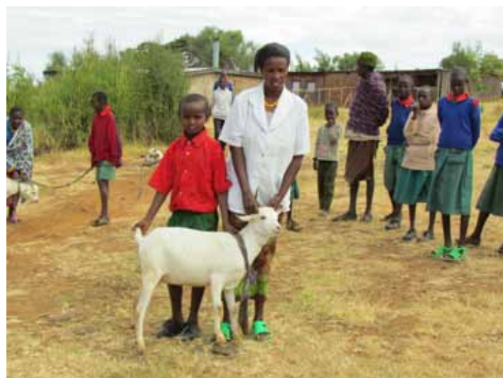
La consegna delle capre.

L'acquisto di una o più capre rappresenta per noi un micro-progetto che proponiamo a quanti ci chiedono appunto di contribuire con offerte di importo diverso alle attività dell'Associazione.