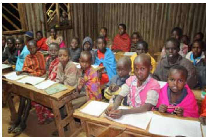
Scuola serale Pastorelli

Continua ad essere il progetto portante di tutta la nostra attività. Iniziato 17 anni fa per consentire ai ragazzi più poveri di frequentare almeno la scuola primaria, nel tempo si è sempre più allargato, grazie al contributo degli adottanti (o sponsor). L'impegno di chi attiva un'adozione,