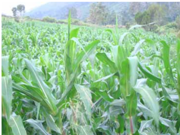
Campo di mais.

Fin dallo scorso anno abbiamo cominciato a dare il via a questo progetto costituendo un fondo iniziale di 3.000 € destinati al prestito a singoli "imprenditori" per l'avvio di attività lavorative o altri investimenti.