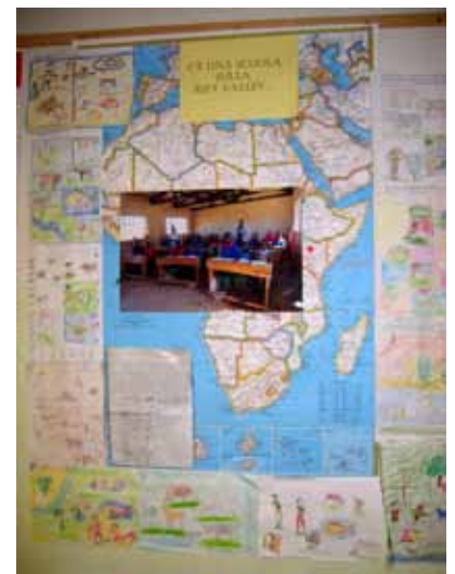
Il cartellone con la foto e i disegni dei ragazzi di Morijo nella classe 2B della media Martini di Treviso

Esperienze analoghe a questa sono in corso anche alla scuola media Martini di Treviso (con lo scambio di corrispondenza in lingua inglese), alla scuola elementare di Zero Branco, alla scuola elementare di San Paolo (Treviso).